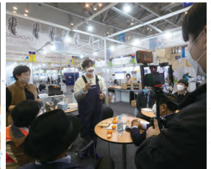
부대행사 : 씨푸드 드라이브스루 판매, 쿠킹 쇼 및 코로나 의료진 대상 도시락 전달, 유튜브 온라인 라이브 방송